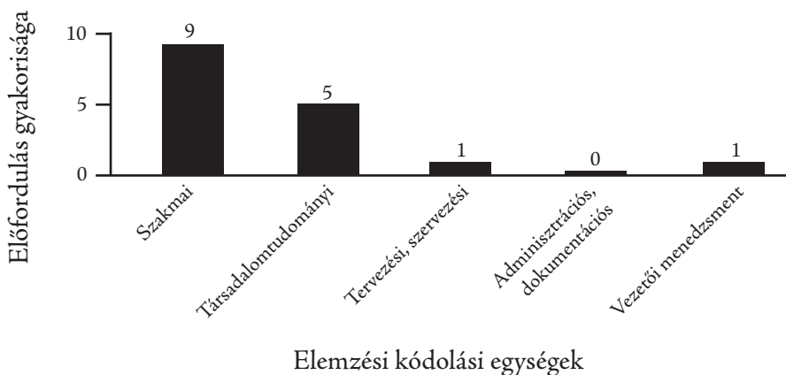
4. ábra Az egészségügyi szociális munka mesterképzési szakon megszerezhető tudás, ismeret, képesség (db)

A mesterképzési szakok esetén először az egészségügyi szociális munka mesterképzési szak vizsgálati eredményét mutatjuk be (4. ábra).