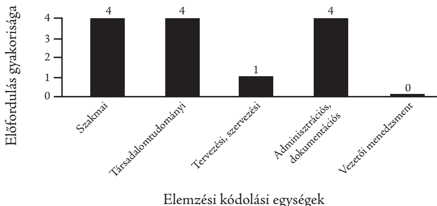
1. ábra A felsőoktatási szakképzés szociális munkás asszisztens szakon megszerzhető tudás, ismeret, képesség (db)

A vizsgált szakon egyenlő arányban szerepelnek a szakmai, a társadalomtudományi valamint az adminisztrációs, dokumentációs ismeretek, tudások, készségek. Alacsony számban (1db) van tervezési, szervezési egységbe bekerült adat és egyáltalán nem volt adat a vezetői, menedzsment kategóriában.